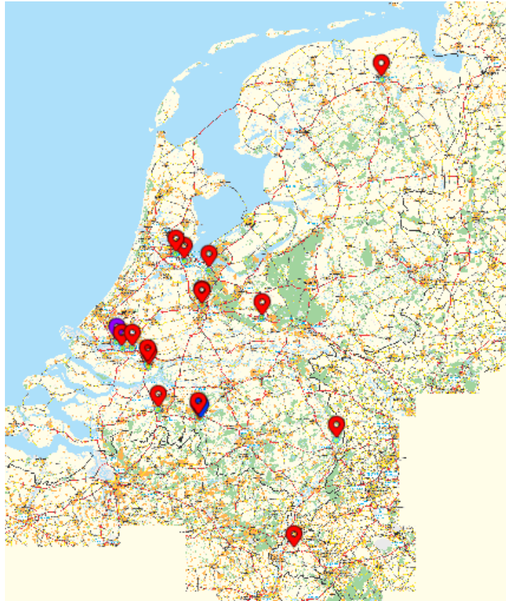
Diefstallocaties van de Turbho RL-50